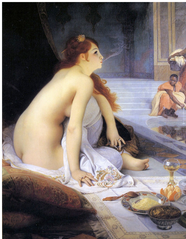
Jean Lecomte du Nouÿ , Die weiße Sklavin, 1888

„India öffnete die Augen. Sie war von blassgoldenen Vorhängen umgeben. Langsam drehte sie den Kopf. Sie lag nackt auf scharlachroten Laken aus Seide . Neben ihr stand ein niedriger Tisch, dessen Oberfläche aus einem blau- und weißfarbenen Mosaik bestand. Auf dem Tisch stand ein kostbarer Becher, der mit einer blassen, pfirsichfarbenen Flüssigkeit gefüllt war. India war unerhört durstig, doch sie konnte sich kaum bewegen. Sie stöhnte leise auf, und im nächsten Augenblick erschien ein schwarzes Gesicht vor ihr. Sie stieß einen erschrockenen Laut aus und versuchte ihre Blöße zu bedecken.“