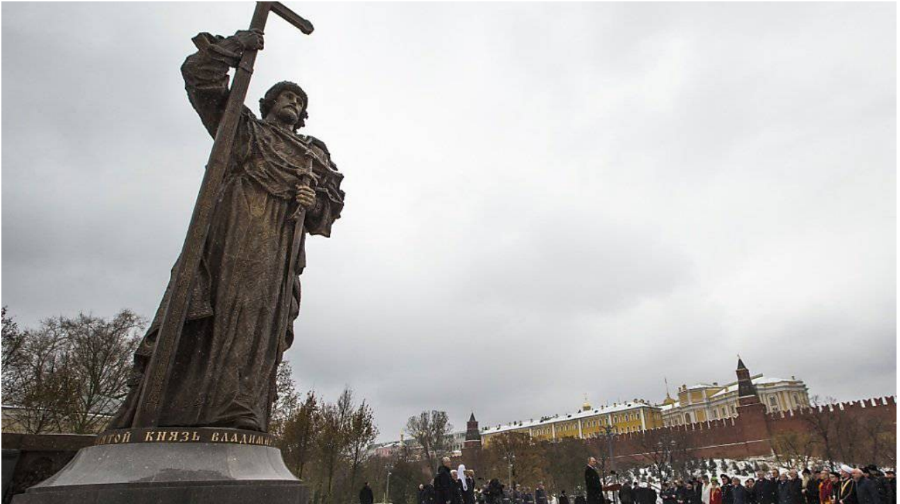
Die Statue Wladimirs und zu ihren Füßen Wladimir Putin am Rednerpult zur Einweihung 2016

noch als Namensgleichheit ausweisen kann: Wladimir I. Damit nimmt dann gleichzeitig auch der historische Anspruch auf die Ukraine als zweites Land neben Weißrussland vom Kreml „groß-russisch“ gerahmt Gestalt an.