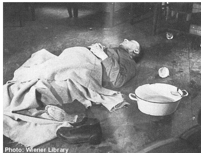
Der tote Himmler in britischem Gewahrsam

„Der Scheißkerl beißt uns!“ Der Geruch von Blausäure verbreitete sich im Raum. „Wir stellten den alten Scheißkerl sofort aufrecht und steckten seinen Mund in eine Wasserschüssel, um das Gift auszuwaschen“, schrieb Major Whittaker später in seinem Tagebuch. „Es kam schreckliches Stöhnen und Grunzen von dem Schwein.“ Himmlers Zunge war gesichert, um zu verhindern, dass er Gift schluckte. Dr. Wells versuchte eine Wiederbelebung, aber vergeblich. Nach einer Viertelstunde wurde sie gestoppt. „... es war eine verlorene Schlacht, und dieses üble Ding hörte um 23:14 Uhr auf zu atmen.““ (Winston G. Ramsey: Himmler's Suicide. In: After the Battle No 14, London 15th August 1976, p. 35.)