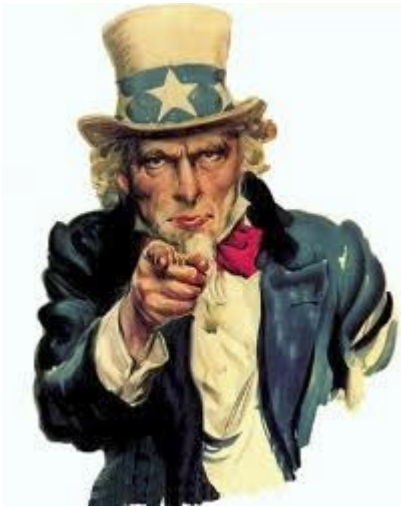
Die nationale Identifikationsfigur des Uncle Sam , durch Senatsbeschluss von 1961 zu Beginn der Kennedy-Präsidentschaft als solche anerkannt

Der erste Teil ist mit „Die neue Grenze“ überschrieben. Was damit gemeint ist, wird an später Stelle auf S. 223 umschrieben, wenn der Leser längst diese Überschrift vergessen hat, nämlich als das, „was Präsident Kennedy die 'neue Grenze' genannt hatte; man musste den klaren Blick und den Mut der Pioniere bewahren, musste aushalten, musste vermeiden, sich zu verzetteln“. 13