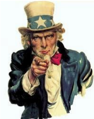
Die nationale Identifikationsfigur des Uncle Sam , durch Senatsbeschluss von 1961 zu Beginn der Kennedy-Präsidentschaft als solche anerkannt

Der erste Teil ist mit „Die neue Grenze“ überschrieben. Was damit gemeint ist, wird an später Stelle auf S. 223 umschrieben, wenn der Leser längst diese Überschrift vergessen hat, nämlich als das, „was Präsident Kennedy die 'neue Grenze' genannt hatte; man musste den klaren Blick und den Mut der Pioniere bewahren, musste aushalten, musste vermeiden, sich zu verzetteln“. 13