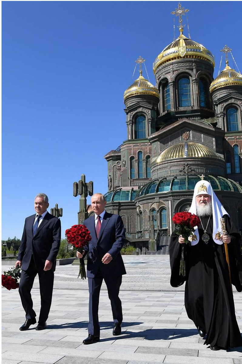
Im Jahr 2000 wurde am Stadtrand von Moskau eine große Kathedrale für die russischen Streitkräfte eingeweiht: Hier von links nach rechts der russische Verteidigungsminister Sergei Schoigu , Wladimir Putin und Patriarch Kyrill I. (siehe: Hauptkirche der Streitkräfte Russlands )

nationalen Kontrollen vielfach angestrebtes nationales Ziel bestimmter nationalideologischer Ausdrucksformen geblieben, an wie viel Geheimhaltung und an welche Gottesvorstellungen das Vorhaben auch immer gebunden ist. Denn „ der Fortschrittsbegriff hat uns apokalypseblind gemacht “ 57 und nutzt in der Unterscheidung der „ Richtigen “ von den „ Falschen “ fortdauernde kulturanthropologische, aber inzwischen noch antiquierter gewordene Auserwähltheitskriterien, in denen das längst überholte Nationalstaatskonzept – mit Putin in absurder, aber rücksichtslos gewalttätiger imperialistischer Wiederaufnahme mit atomarer Drohung – immer wieder in antiquiertem Autonomieanspruch der ganzen Welt gegenüber fröhlich (?) seine Urständ feiert. 58